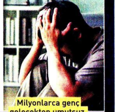
Milyonlarca genç gelecekten umutsuz.

da yol açıyor. Ankara Sanayi Odası'nın raporuna göre gençlerin evde oturması nedeniyle ülke ekonomisi sadece 2025 yılında 2.8 trilyon lira kaybetti. Son 5 yıllık kayıp ise 11.1 trilyon lira oldu. Acil önlem alınmazsa bu maliyetin katlanacağını belirten ASO, gerekli çalışmalar yapılırsa 2 milyona yakın gencin evden çıkıp üretime katılacağını hesapladı.