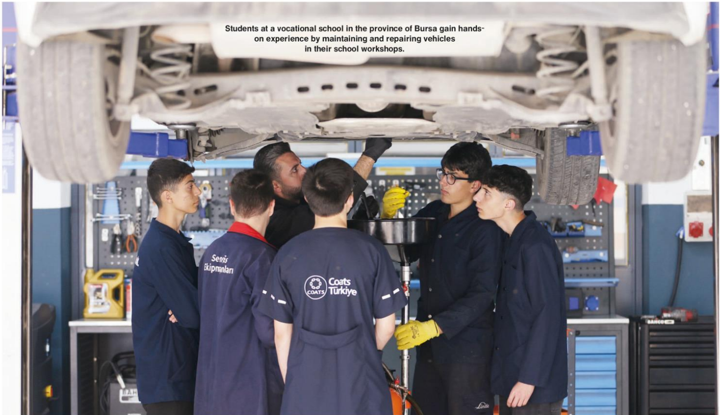
Students at a vocational school in the province of Bursa gain hands-on experience by maintaining and repairing vehicles in their school workshops.